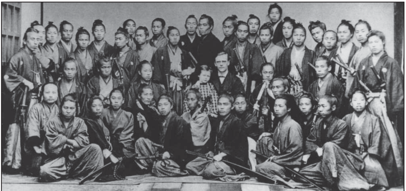
Guido Herman Fridolin Verbeek (früher: Verbeek; 28.01.1830 – 10.05.1898), holländisch-stämmiger Missionar und einflussreicher ausländischer Berater des Meiji-Kaisers inmitten der japanischen Gründungsväter

Als sie später mit dem westlichen Rassismus konfrontiert wurden, entschlossen sich die japanischen Freimaurer, ganz Asien zu erobern und zu modernisieren. Ihr Ziel war es, sich auf einen letzten Showdown