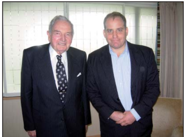
David Rockefeller und Benjamin Fulford

„Es gibt Vieles, worüber ich schweigen muss, aber ich garantiere Ihnen, dass ich eher in der Hölle schmoren würde als zur Gegenseite überzulaufen. Denn die Hölle ist wenigstens nur absolute und ewige Vergessenheit. Ich sagte ihm, dass ich ihn für den Zauberer von Oz halte und dass wir alle gerne nach Kansas zurückgehen würden. Er hatte noch zwei Angestellte bei sich und der Großteil des Gesprächs wurde auf Band aufgezeichnet; daher hatte ich keine Möglichkeit, ihn dazu zu bringen,